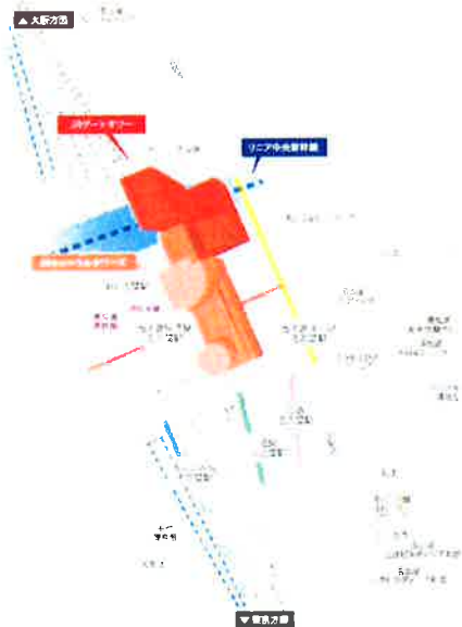
JRゲートタワー 15階 レイアウト